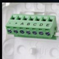
Wysuwana listwa zaciskowa