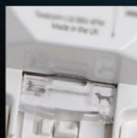
Zgodność z EN w trybie odporności na zwierzęta