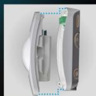
Innowacyjny system zamykania obudowy