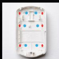
Dopasowane punkty montażowe